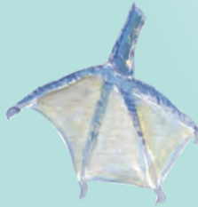
Detalle de la pata del cormorán

Observa en el dibujo que el cormorán tiene los cuatro dedos unidos por una membrana. ¿Para qué crees que le sirve esta membrana?