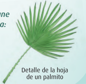
Detalle de la hoja de un palmito